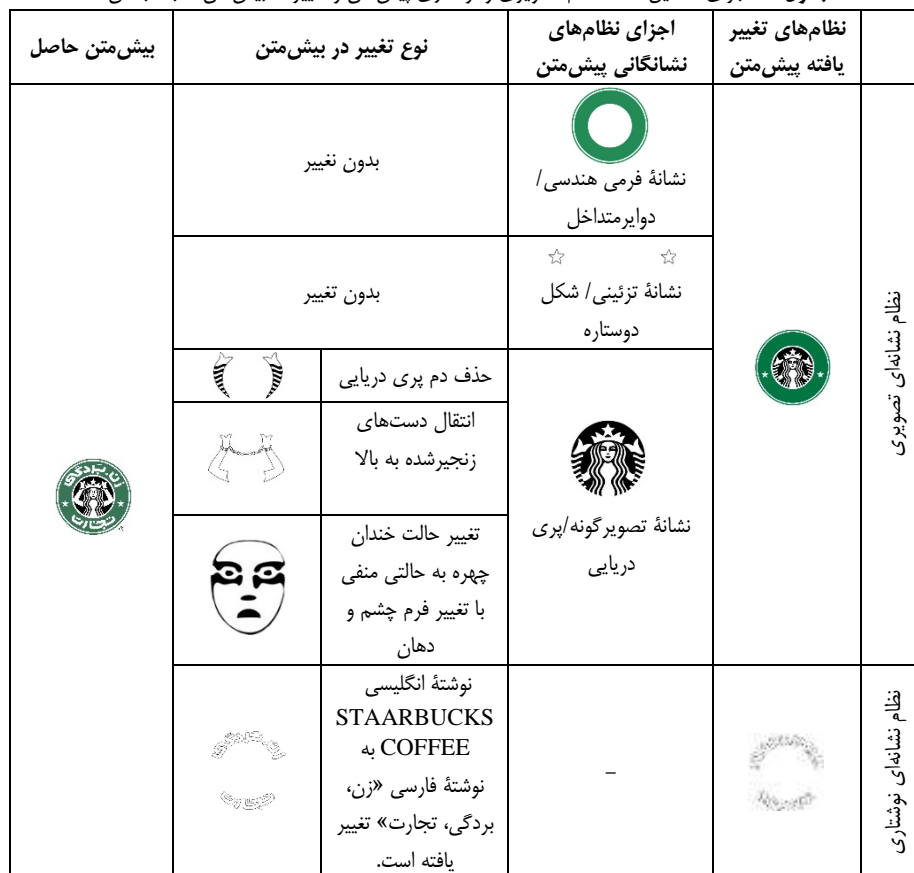
جدول ۳. اجزای تشکیل‌دهنده نظام تصویری و نوشتاری پیش‌متن و تغییرات بیش‌متن نسبت به آن

است، بر نمایشی بودن این ژست تأکید دارد. اما در بیش‌متن، یعنی اثر نجابتی، دم‌ها حذف شده‌اند. این نوع تقلیل حجم پیش‌متن، تراکونگی کمی از نوع کاهشی یعنی پیرایش (حذف مضمون) است و از منظر ژنت برش متن نامیده می‌شود. منظور از برش متن، اعمال تغییراتی در متن و استعلائی آن از طریق جراحی و حذف بخش‌های زائد و بلااستفاده متن است. در این‌گونه از گشتار کمی، مؤلف بیش‌متن بنا به ضرورت ادبی-هنری، بخش‌هایی از پیش‌متن را حذف می‌کند که جنبه موضوعی دارد. با حذف دم، علاوه بر ایجاد تعادل بصری و جلوگیری از شلوغی در جهت حفظ ترکیب‌بندی مناسب به دلیل لزوم جانشینی دست‌ها، جنبه نمایشی سایرین نیز حذف شده است؛ بنابراین این شخصیت بی‌دم دیگر سایرین اساطیری نیست، بلکه نمادی از زن در جامعه مدرن است.