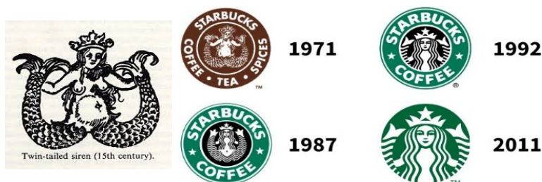
تصویر ۱. راست: سیر تغییرات لوگو استارباکس در طول زمان (URL3)؛ چپ: تصویر سایرین اساطیری مورد اقتباس بنیان‌گذاران استارباکس (URL2)

آوازشان چنان دل‌انگیز بود که هرکس آن را می‌شنید فریفته می‌شد و با افتادن به چنگ آنان جانفش را از دست می‌داد (Durant, 1958: 73). لوگو استارباکس گیرا، مرموز و به قول تری‌هکلر ۱ ، اولین و مهم‌ترین طراح در طول تاریخچه لوگو استارباکس، استعاره‌ای عالی برای آواز سیرن قهوه است که ما را به سمت فنجان می‌کشاند (URL1). سایرین جذاب بود و ملوانان را به سمت خود می‌کشاند. این دقیقاً همان چیزی بود که بنیان‌گذاران به دنبال آن بودند: جذب کردن دوستداران قهوه. همان‌طور که هیچ‌کس نتوانست در برابر سایرین مقاومت کند، به نظر می‌رسد استارباکس امیدوار است مشتریان به همان اندازه جذب قهوه او شوند. پری دریایی نشان‌دهنده وسواس، اعتیاد و به‌دام‌افتادن است. مانند بسیاری از نمادها، ظاهر این لوگو با تغییر زمان سازگار شد و در سال ۱۹۸۷، سپس در سال ۱۹۹۲ و بعد از آن در سال ۲۰۱۱ تغییراتی کرد؛ هرچند ماهیتش یکسان باقی مانده است (تصویر ۱-راست).