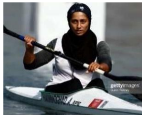
تصویر ۱۴. مسابقات المپیک ۲۰۱۲