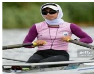
تصویر ۱۰. مسابقات قایقرانی روئینک، المپیک ۲۰۱۲ لندن