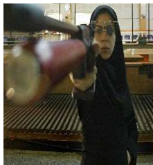
تصویر ۳. تمرینات آماده‌سازی المپیک ۲۰۰۴