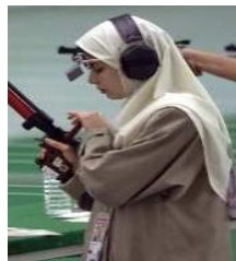
تصویر ۲. سیزدهمین دوره بازی‌های آسیایی بانکوک ۲۰۰۰