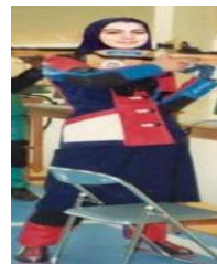
تصویر ۱. مسابقات المپیک ۱۹۹۶