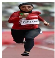
تصویر ۳۰. المپیک ۲۰۲۰ توکیو