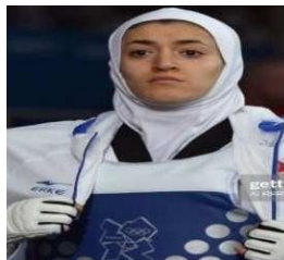
تصویر ۱۳. مسابقات قایقرانی روئینگ،