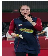
تصویر ۲۶. مسابقات تکواندو، تصویر ۲۷. در المپیک ۲۰۲۰ توکیو