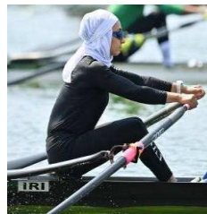
تصویر ۲۵. المپیک ۲۰۲۰ توکیو