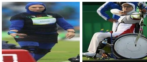
تصویر ۱۸. مسابقات تیروکمان، ۲۰۱۶ تصویر ۱۹. مسابقات پرتاب وزنه، المپیک ۲۰۱۶ ریو