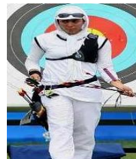
تصویر ۴. مسابقات تیراندازی تیروکمان، المپیک ۲۰۰۸