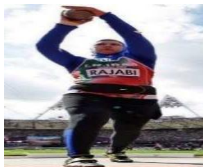
تصویر ۱۲. مسابقات پرتاب وزنه، المپیک ۲۰۱۲ لندن