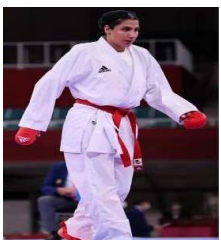
تصویر ۲۹. المپیک ۲۰۲۰ توکیو