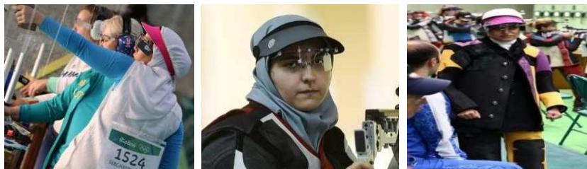
تصویر ۱۵. مسابقات تفنگ بادی، المپیک ۲۰۱۶ ریو تصویر ۱۶. رشته تفنگ بادی، المپیک ۲۰۱۶ ریو تصویر ۱۷. رشته تپانچه، المپیک ۲۰۱۶ ریو

پاجامه در المپیک ۲۰۱۶ شامل شلوارهای تخصصی برای رشته‌های تیراندازی با تفنگ بادی و تکواندو، لگ ورزشی در رشته‌های قایقرانی و شلوار دمپاکش برای رشته پرتاب وزنه است. در تیراندازی با کمان و تنیس روی میز، شلوار ورزشی به صورت راسته است.