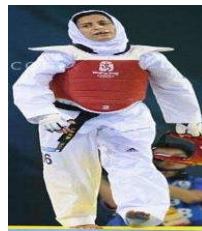
تصویر ۵. مسابقات تکواندو، المپیک ۲۰۰۸