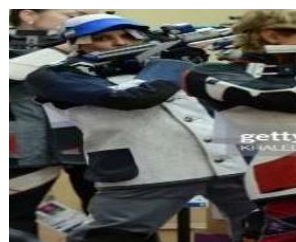
تصویر ۷. مسابقات تفنگ بادی، المپیک ۲۰۱۲ لندن