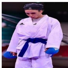
تصویر ۲۸. مسابقات کاراته، المپیک