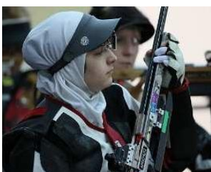
تصویر ۸. مسابقات تفنگ بادی، المپیک ۲۰۱۲ لندن