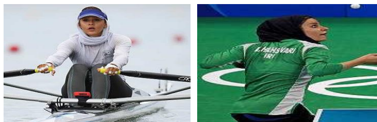
تصویر ۲۰. مسابقات تنیس روی میز، المپیک ۲۰۱۶ ریو تصویر ۲۱. در مسابقات المپیک ۲۰۱۶ ریو