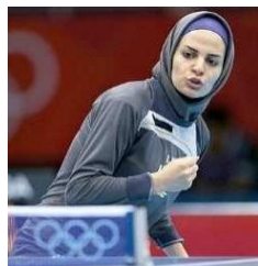
تصویر ۱۱. مسابقات المپیک ۲۰۱۲ لندن