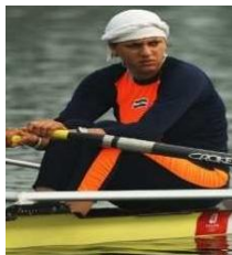
تصویر ۶. مسابقات قایقرانی روئینگ المپیک ۲۰۰۸