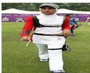
تصویر ۹. مسابقات تیراندازی با تیروکمان، المپیک ۲۰۱۲ منبع: URL9

پاجامه‌ها در المپیک ۲۰۱۲، در تکواندو و تیراندازی با تفنگ بادی، شلوار مخصوص برای این رشته‌های ورزشی است. در تیراندازی با کمان، شلواری راسته و هماهنگ با سارافون پوشیده شده است. شلواری زنانهٔ قایقرانی و پرتاب وزنه، به صورت لگ و از جنس پارچهٔ استرج ۲ هستند. همچنین دامنی کوتاه همراه با لگ ورزشی در پاجامه برای پوشاندن قسمت فاق ورزشکار پرتاب وزنه، از دیگر بخش‌های پاجامهٔ زنان در این دوره است.