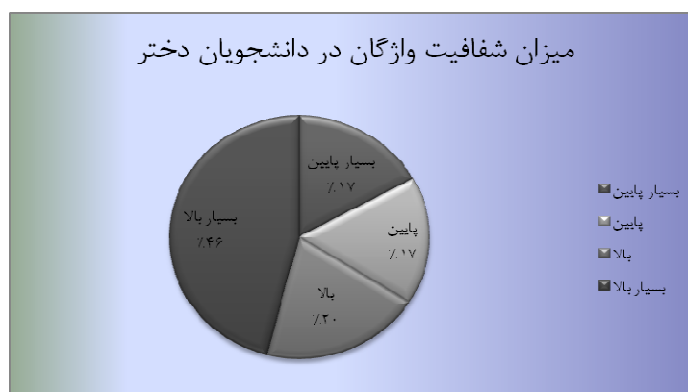
نمودار ۳. میزان شفافیت واژگان در دانشجویان دختر

نمودار ۴ میزان شفافیت واژگان در دانشجویان پسر را نمایش می‌دهد. در دانشجویان پسر ۴۳ درصد واژگان از شفافیت بسیار بالا، ۲۱ درصد از شفافیت بالا، ۱۴ درصد از شفافیت پایین و ۲۲ درصد هم از شفافیت بسیار پایین برخوردار هستند. همان‌گونه که در نمودارهای ۳ و ۴ مشاهده می‌شود، میزان شفافیت واژگان به‌ترتیب در دانشجویان دختر و پسر نمایش داده شده است. از آنجایی که هدف سنجش شفافیت است، واژه‌هایی که از شفافیت بالا و بسیار بالا برخوردار می‌باشند، مدنظر هستند. میانگین شفافیت واژگان در دانشجویان دختر ۳۳ درصد می‌باشد. در حالی که این مقدار برای دانشجویان پسر ۳۲