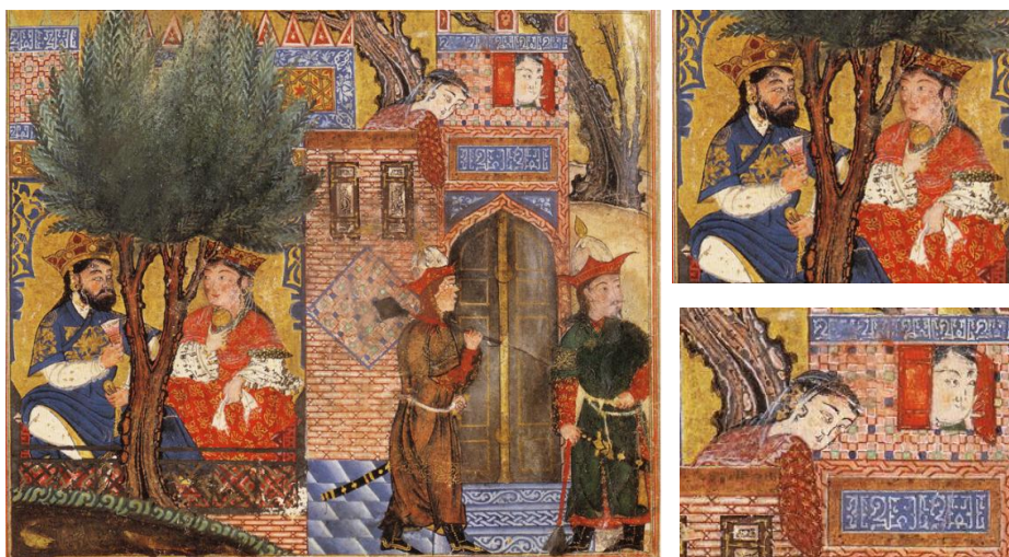
شکل ۱. انوشیروان در خانه مهیود

داستان از این قرار است: انوشیروان، پادشاه نامدار ایرانی، وزیری حکیم به نام مهیود داشته که در محضر وی صاحب نفوذ و محرم اسرار بوده. این امر باعث حسادت بسیاری از جمله زروان شد. مهیود به عنوان امین پادشاه وظیفه داشت هر روز برای پادشاه ظرفی از بهترین غذاها تهیه کند و توسط دو پسرش برای وی بفرستد. زروان برای نابودی وی از یک جادوگر یهودی کمک خواستند و بدین ترتیب چند روز بعد زروان سر راه پسران مهیود قرار گرفت و از آنان خواست سرپوش غذا را بردارند. چون سرپوش غذا برداشته شد، بر آن سحر دمید. پسران مهیود که از ماجرا آگاه نبودند، غذا را بر خوان انوشیروان نهادند. در این لحظه، زروان سراسیمه رسیده و به انوشیروان گفت که غذا به زهر آلوده است. چون پسران برای اطمینان پادشاه از صحت غذا از آن تناول کردند به یکباره جان دادند و پادشاه دستور به قتل مهیود و خویشان وی داد. اما این نیرنگ در نهایت فاش شد و انوشیروان دستور داد زروان و جادوگر را نیز بر دار آویختند. مضمون این داستان بسیار شبیه وقایعی است که در دربارهای ایلخانی رخ می‌داده است.