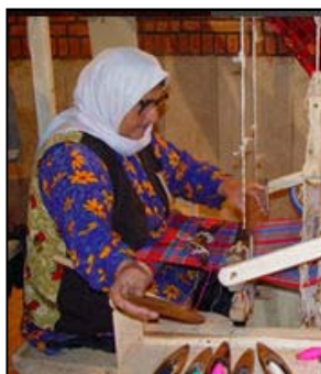
شکل ۹. پوشاک سنتی زنان لر خوزستان

«زیرجومه»: تن‌پوشی گشاد و راحت که یقه گرد با آستین‌های کوتاه دارد و لبه‌های آن با نوارهای رنگی تزئین می‌شود. «جومه»: تن‌پوشی بلند از جنس مخمل با یقه هفت و دو چاک از طرفین آن در قسمت کمر به پایین که لبه‌هایش با نوار رنگی و سکه تزئین می‌شود. «جلیقه»: تن‌پوش بی‌آستین با دو جیب از جنس مخمل با تزئینات است.