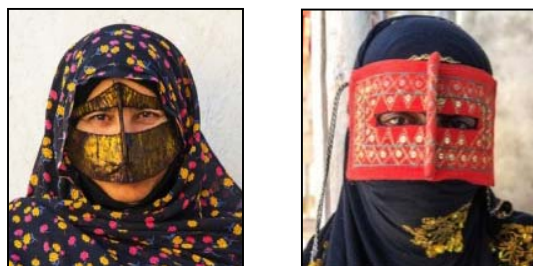
شکل ۴. برقع سرخ یا بلوچی و برقع شیله‌ای