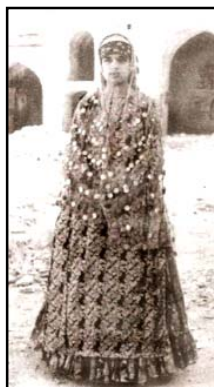
شکل ۲. پوشاک سنتی زنان دشتستان