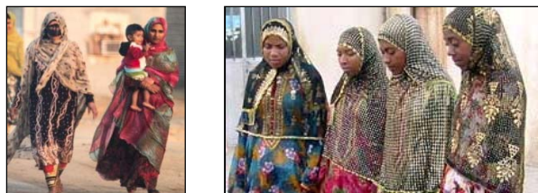
شکل ۳. سرجامه‌های سنتی زنان بندر

«چادر بندری»: چادر رنگ‌ها و طرح‌های گوناگون دارد. نوعروسان از چادر گل ابریشمی سبز استفاده می‌کنند که حاشیه زیبایی دارد و پشت آن با «اشرمه» ۱ تزئین می‌شود. عروس و نوعروسان از چادر ساده سبزرنگ با تزئینات خوس و گلابتون و پولک بوتهدوزی نیز استفاده می‌کنند. در پوشاک بانوان هرمزگان، ملحقاتی وجود دارد که علاوه بر وجه تزئینی، جنبه کاربردی نیز دارد و نقاب یکی از ملحقات مهم است.