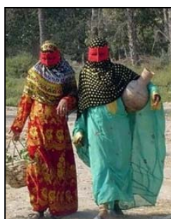
شکل ۵. تن جامه سنتی زنان هرمزگان

«پیراهن کمرچین»: کمرچین یا دورچین پیراهنی است که در بندرعباس و شهرهای اطراف آن چون میناب و رودان رواج دارد. بالاتنه در آن ساده با یقه گرد یا هفت است. آستین‌ها دوتکه و شامل تکه‌آستین و سرآستین‌ها (مچ) است. دامن این پیراهن دوتکه است و هر تکه دو برابر تکه قبلی انتخاب شده و با چین‌های منظمی به یکدیگر وصل می‌شود و دو جیب دارد. قد دامن تا بالای زانو است. بعضی از درزهای آن با نوار تزئین می‌شود.