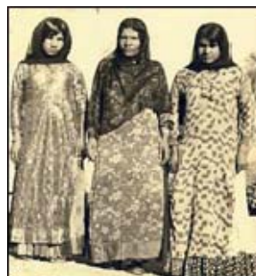
شکل ۱. لباس سنتی زنان بوشهر

به‌طور کلی، پوشاک زنان در این استان متشکل از پیراهن بلند دورچین، شلوار چیت و کفش صندل و در مجامع عمومی‌تر همراه عبای سیاه یا چادر محلی، مقنعه نازک و سیاه و روبنده نازک است. پیراهن رسمی‌تر زنان بوشهر جامه گشادی است که به آن پیراهن عربی می‌گویند و تزئین شده است. انواع پوشاک سنتی دشتستانی را می‌توان چنین توصیف کرد: