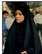
شکل ۸. سرجامه و تن‌جامه سنتی زنان عرب خوزستان