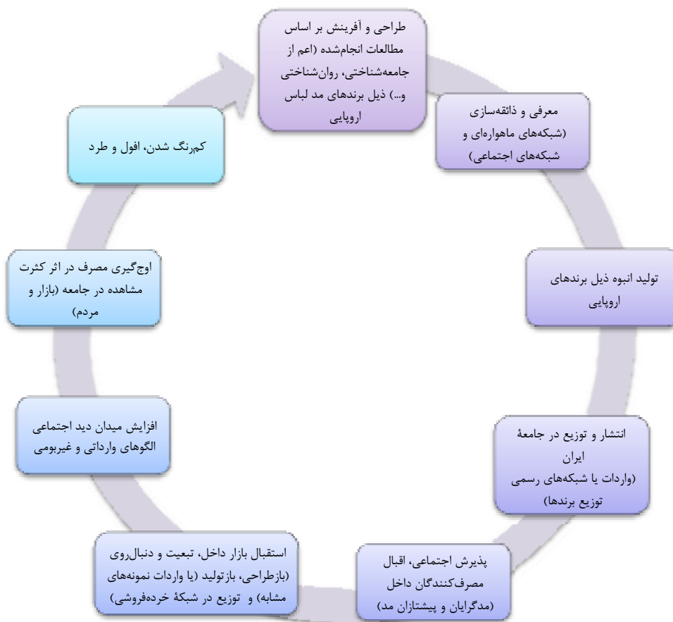
شکل ۳. وضعیت موجود چرخه مد لباس در جامعه ایران

نکته شایان توجه در نسبت و تقدم و تأخر مراحل یادشده آن است که این مراحل به صورت پیوسته، در هم آمیخته و بعضاً موازی اتفاق می‌افتد و به هیچ‌وجه قابل تفکیک از یکدیگر نیستند. در پایان، در جمع‌بندی وضعیت چرخه مد ایران بر مبنای نظریه‌های ارائه‌شده، به نظر می‌رسد نظریه انتخاب جمعی هربرت بلومر در مقابل نظریه بالا به پایین جورج زیمل در توضیح چرخه مد لباس در جامعه ایران تا حدی گویاتر و مناسب‌تر باشد. اینکه مکانیسم مد نه در پاسخ به نیاز تمایز طبقاتی و تقلید طبقاتی، بلکه در پاسخ به میل «در مد بودن»، میل به اظهار سلیقه‌های جدید در یک جهان متغیر پدیدار می‌شود. تأکید صورت‌گرفته بر نقش فضای اجتماعی و اطرافیان و مقبولیت اجتماعی یک سبک و پرهیز از اینکه در نگاه دیگران «قدیمی