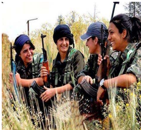
تصویر ۱. گریلاهای زن مدافع خلق در کوبانی