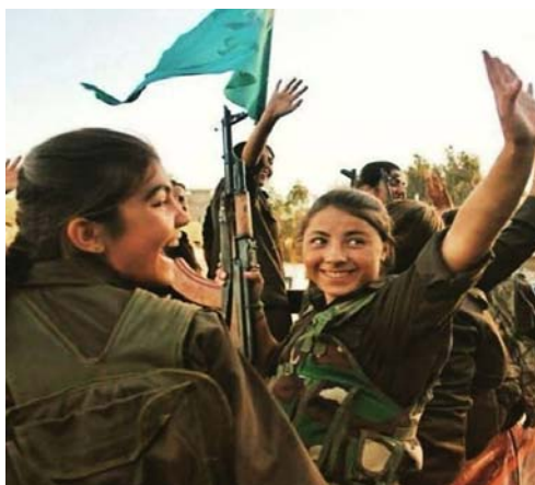
تصویر ۲. گریلاهای زن مدافع خلق در کوبانی

در اینجا با تغییری دیگر مواجهیم. آنچه زنان کرد از جنگ، به‌ویژه جنگ با داعش، درک می‌کنند بیشتر فرمی از مقاومت است تا جنگ. مقاومت فرمی از مبارزه برای زندگی است، اما جنگ ممکن است برای حمله به دیگری صورت بگیرد. این مسئله را می‌توان در نام یکی از صفحه‌های عمومی در فیس‌بوک در زمینه مبارزه زنان کوبانی مشاهده کرد: «مقاومت، زندگی است.» زنان کرد تجربه مقاومت زنانه در کوبانی را به‌منزله تجربه‌ای درک می‌کنند که در آن کنش زنانه به اوج خود می‌رسد. زنان عاملیت خودشان را نشان می‌دهند و مرکزیت مردانه در جنگ و مقاومت را به چالش می‌کشند. یکی از زنان کرد در صفحه فیس‌بوک خویش چنین نوشته است: