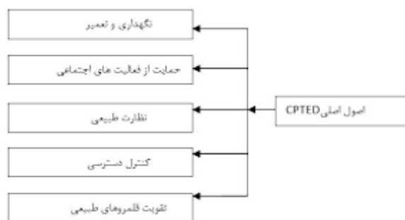
نمودار ۱. مؤلفه‌های مدل پیشگیری از جرم [۱۴]

امکانات و تسهیلات به وجود می‌آورند. در فضاهای مختص بانوان زنان قادر به سهیم بودن تجارب خود باهم هستند و همچنین بر احساس انزوای خود در جامعه غلبه می‌کنند. محیط فیزیکی می‌تواند تأثیرات مستقیمی بر بستر جرم به‌وسیله طرح قلمروها، کاهش یا افزایش دسترسی‌ها، به وسیله تقویت مرزها داشته باشد. یک محیط دارای عرض کمتر نسبت به جرم آسیب‌پذیرتر است، زیرا فعالیت‌ها را محدود می‌کند و برای افراد ارتکاب جرم را آسان‌تر می‌کند. جفری براساس نتایج و محققان قبلی نظریه CPTED را در کتابش در سال ۱۹۷۱ به نام جلوگیری از جرم با استفاده از طراحی محیط ارائه داد [۱۴، ص ۲۱۰-۲۳۰]. جفری در نظریه‌اش بر نقش محیط فیزیکی در ایجاد تجربیات هنجار و ناهنجار مختلفی که ظرفیت تغییر رفتار را دارد تأکید می‌کند.