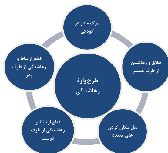
تصویر ۱. شکل‌گیری و تکرار طرح‌واره رهاشدگی

است که از دست دادن پدر یا مادر در سنین پایین یکی از سرچشمه‌های اصلی طرح‌واره رهاشدگی است [۱۳، ص ۱۱۹]. از دیدگاه او، بسیاری از طرح‌واره‌ها در اوایل زندگی شکل می‌گیرند، به تدریج بسط و گسترش پیدا می‌کنند، سپس خود را به تجارب بعدی زندگی شخص تحمیل می‌کنند [۱۵، ص ۲۹]. یانگ همچنین بیان می‌کند که قوی‌ترین محرک‌های طرح‌واره رهاشدگی «جدایی‌های حقیقی و واقعی همچون طلاق، نقل مکان کردن یک شخص یا مرگ هستند، اما عوامل محرک معمولاً شامل رویدادهای ظریف‌تری نیز می‌شوند» [۱۳، ص ۱۱۱]. در روند فیلم، علاوه بر مرگ مادر مینا، به مواردی چون طلاق، ترک تحصیل، قطع ارتباط با پدر، نقل مکان‌های متعدد (خانه پدری، خانه شوهر و خانه دوست قدیمی‌اش) نیز اشاره می‌شود. مینا، به دلایلی که در فیلم بیان نمی‌شود، پس از طلاق نزد پدر خود باز نمی‌گردد و پدر نیز از او سراغی نمی‌گیرد. او پس از رهاکردن اجباری تحصیلات و ترک دانشگاه به دنبال کار و شغلی مناسب است و به‌طور موقت در خانه دوست خود، آیلا، که با تنها فرزندش زندگی می‌کند، مستقر می‌شود. اما پس از استخدام در رستوران و آشنایی با کامران، از خانه دوست خود نیز نقل مکان می‌کند و ارتباط بین آن‌ها قطع می‌شود. در واقع، برخی حوادث زندگی مینا در نیمه اول فیلم همچون مرگ مادر، طلاق و رهاشدن از طرف همسر، قطع ارتباط و رهاشدگی از طرف پدر، دوست و نقل مکان‌های متعدد را می‌توان از محرک‌هایی دانست که نشان از شکل‌گیری و تکرار طرح‌واره «رهاشدگی» در شخصیت او دارد (تصویر ۱).