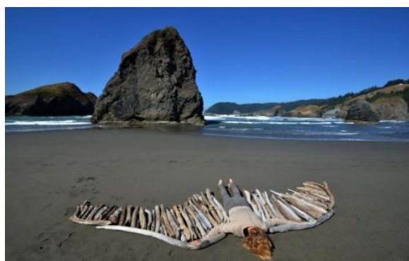
تصویر ۱۴. کارین وندرمولن، اولین سوء قصد من، چوب‌های سرگردان (۲۰۱۵)، آرشیو شخصی هنرمند