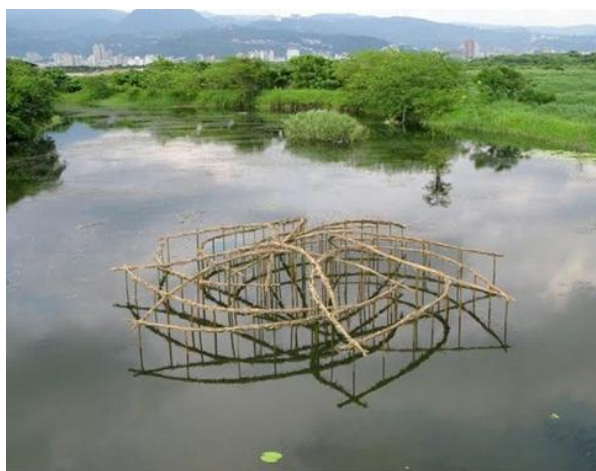
تصویر ۱. روی استب، مرکز انرژی، تایوان، بامبو، علف و مواد تجدیدپذیر (۲۰۰۹)، آرشیو شخصی هنرمند

یکی از معیارهایی که نوع روابط جنسیتی در جامعه را نشان می‌دهد، جنبه‌های گوناگونی دارد. بستر اجتماعی، فرهنگی، مذهبی و اقتصادی در شکل‌گیری هنر زنان در هر دوره، چه به‌عنوان هنرمند و چه به‌عنوان موضوع هنر، نقش مهمی ایفا کرده‌اند. سازوکارهای اجتماعی بی‌شک نوعی مناسبات جنسیتی را رقم می‌زند که در چگونگی و ابعاد حضور زنان در دنیای هنر تعیین‌کننده بوده است [۱۸].