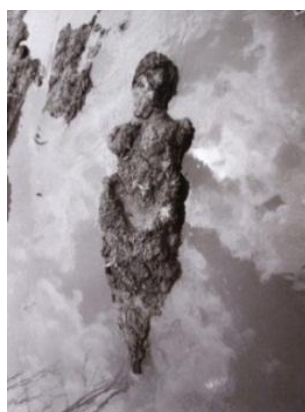
تصویر ۶. آنا مندیتا، از مجموعه سیلوئت‌ها، گل (۱۹۷۴) [۳۷، ص ۹۱]