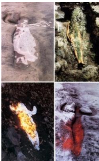
تصویر ۸. آنا مندیتا، از مجموعه سیلوئت‌ها (۱۹۷۳-۱۹۸۰) [۳۷، ص ۷۶]