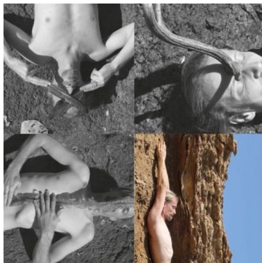
تصویر ۳. پیتر آلیار، بدون عنوان، افریقای جنوبی (۲۰۱۶)

متفاوت است. این بار هنرمند محیطی از طریق چیدمان بدن خود در طبیعت یا از طریق اجزای ساده، بدن خود را به عنوان یک ابژه با طبیعت گره زده است تا مخاطبانشان را از طریق طبیعت درگیر مفهوم و محتوای اثرش کند. در میان هنرمندان معاصر فعال در حیطه هنر محیطی نیز، هنرمندان زن و مرد زیادی وجود دارند که بارها از بدن خود در موقعیت‌های مختلف، بسته به ساختار محیطی که در آن قرار دارند برای خلق آثارشان، استفاده کرده‌اند. آن‌ها از این طریق، اجزای موقت و کوتاه مدتی را در طبیعت در برابر دید مخاطبان خود در معرض نمایش می‌گذارند تا (از طریق «بدن» که بی‌واسطه‌ترین عنصر ارتباطی بین هنرمند و طبیعت است) با محیط پیرامونش یکی شوند و خود را جزئی از طبیعت و محیط پیرامونشان احساس کنند (تصاویر ۳ و ۴). با نگاهی به آثار پیتر آلیار (۱۹۷۵)، هنرمند رومانیایی که از سال ۱۹۹۶ در حیطه هنر اجرا و هنر چیدمان فعال است، این بی‌واسطگی استفاده از بدن در طبیعت را به زیبایی می‌توان مشاهده کرد. این هنرمند از سال ۲۰۰۸ در کنار اجراهایش در عرصه بین‌المللی به عنوان هنرمند هنر طبیعت و هنر اجرا شناخته شده است. بدن در اغلب آثار آلیار در طبیعت حضور بسیار پررنگی دارد. آلیار با تمرکز بر بدنش، به منزله مهم‌ترین ابزار اجراهای هنری‌اش، در طبیعت حضور پیدا می‌کند و در پی تفکرات عرفانی که هنرمند در طول زندگی خود دنبال کرده در ترکیب بدنش با عناصری مانند چوب یا سنگ در اجراهای کوتاه مدت خود جزء جدایی‌ناپذیر از طبیعت می‌شود. اما با توجه به تمرکز پژوهش بر آثار هنرمندان زن انتخاب شده، فقط به آثار این هنرمند مرد برای نمونه پرداخته شده است.