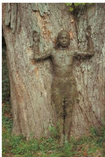
تصویر ۹. آنا مندیتا، درخت زندگی (۱۹۷۳) [۳۳، ص ۲۱]