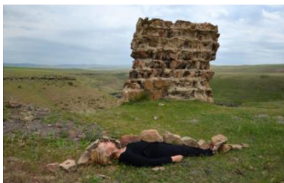
تصویر ۱۵. کارین وندرمولن، بار تمدن. مرز ترکیه/ارمنستان، سنگ (۲۰۱۷)