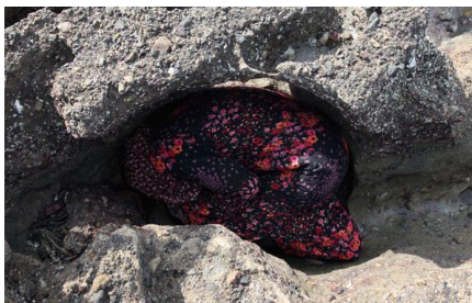
تصویر ۱۶. تارا گودرزی، چمباتمه، جزیره هرمز (۱۳۸۹)، ایران