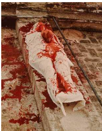
تصویر ۵. آنا مندیتا، از مجموعه سیلوئت‌ها، خون (۱۹۷۴) [۲۱، ص ۳۷]

خشونت بار و افراطی مذهب سانته‌ریا ارائه داده است. هنرمند از طریق این اجرا توانسته مخاطبانش را به شدت تحت تأثیر خشونت اعمال مذهبی و فرهنگی سرزمینی که در آن متولد شده است قرار دهد؛ همان آیین‌ها و قوانین آزاردهنده حاکم بر جامعه سرزمین مادری‌اش که هنرمند را به مهاجرت در شانزده سالگی مجبور کرده است. علاوه بر موارد مطرح شده، در واقع آثار مندیتا دربرگیرنده مفاهیم انقلابی است. آثار او ارتباطی است بین روح، زمین، بدن و خاک. ویدئوها و عکس‌های جمع‌آوری شده از مجسمه‌های خارق‌العاده و نیز اجراهای او، که با متریال‌هایی از جنس شن، خاک، آب، گل رس، گل ولای (تصویر ۶)، صخره، خون و آتش خلق کرده است، از بیان و نحوه استفاده سمبلیک او از بدنش روی زمین و در طبیعت حکایت دارد.