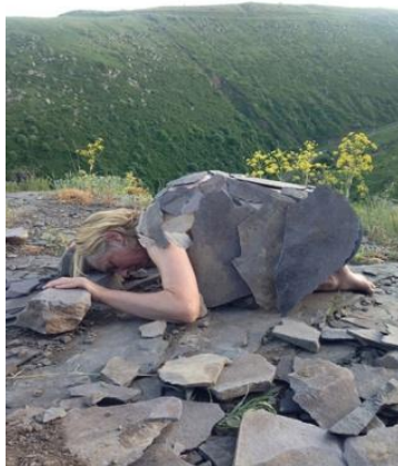
تصویر ۱۳. کارین وندرمولن، آرامش قبل از طوفان، سنگ (۲۰۱۷)