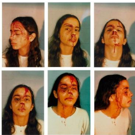
تصویر ۷. آنا مندیتا، سلف پرتره (۱۹۷۶) [۳۷، ص ۷۶]

مندیتا درباره آثار خود می‌گوید: «جست‌وجوی من از طریق هنر ارتباطی است بین خود و طبیعت که بازتابی است در نتیجه جداشدن از سرزمین مادری‌ام. هنر من مبتنی است بر اعتقاد به یک انرژی جهانی که به‌واسطه آن همه‌چیز قابل اجراست: از حشرات به انسان، از ارواح به ارواح و از ارواح به گیاهان.» مجموعه سیلوئت‌ها ۱ شاخص‌ترین سری آثار هنری او هستند که به اشکال و متریال‌های مختلف عموماً در طبیعت اجرا شده‌اند. مندیتا بیان می‌کند: «ساختن مجموعه سیلوئت‌ها در طبیعت گذری است بین سرزمین مادری‌ام در کوبا و سرزمین جدیدی که در آن ساکنم. این نحوه بیان هنری شیوه‌ای است برای بازیافتن ریشه‌هایم و یکی‌شدن با طبیعت. اگرچه فرهنگی که در آن زندگی می‌کنم بخشی از وجود من است، ریشه‌ها و هویت فرهنگی من، که نتیجه میراث کوبایی من است، عامل شکل‌گیری آثار هنری‌ام شده است؛ آثاری که الهام‌گرفته از طبیعت و نیروی زنانگی است.» آثار مندیتا دربرگیرنده فضایی است نامشخص و سیال بین هنر زمین، هنر بدن و هنر اجرا [۳۳، ص ۲۱]. وندرمولن (۲۰۱۷) درباره مندیتا چنین می‌گوید: «مندیتا از طریق مجسمه‌های زمین/بدنی با زمین یکی می‌شود. او امتدادی است از طبیعت و طبیعت امتدادی است از بدن هنرمند» (۱۲ اوت، مصاحبه شخصی). استب (۲۰۱۷) نیز بیان می‌کند با توجه به اینکه یکی از هم‌کلاسی‌های مندیتا در آن زمان مورد آزار جنسی قرار گرفته بوده است، این مسئله تأثیری عمیق بر ذهنیت و نحوه ارائه آثار هنری او در آن دوره گذاشته است. استب معتقد است که مندیتا فردی مذهبی نبوده است، بلکه از مذهب سنتی کوبایی خود به‌منزله منبعی برای الهام‌گرفتن و بیان آثار زنانه و اعتراضی خود استفاده کرده است. او در اثر بی‌عنوان خود (برگرفته از صحنه تجاوز)، تحت تأثیر وحشتی