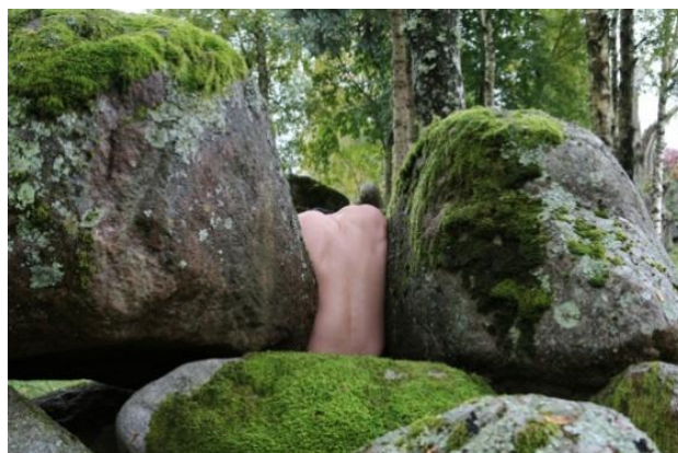
تصویر ۲. کو یو-هان، بدون عنوان، کره جنوبی، (۲۰۱۹)