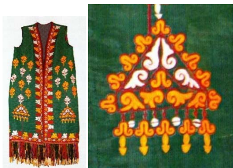
تصویر ۱۰. چاپیت زنان ترکمن با نقش سوزن‌دوزی شده دو تومار [۳۰، ص ۷۲]

فرم مثلث برای طراحی و ساخت اسباب دفع چشم‌زخم در میان بسیاری از اقوام در سرتاسر ایران رواج دارد و فقط مختص به اقوام ترکمن نیست. در تصویر ۱۰ نقشی سه‌گوش به شکل تومار روی لباس سنتی زن ترکمن سوزن‌دوزی شده است.