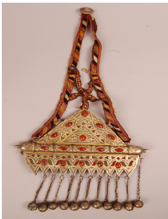
تصویر ۵. تومار نمونه ۴

۵. شرابه‌ها به لحاظ ساختار از دو جز زنجیر و زنگونه کروی تشکیل شده است. در برخی نمونه‌ها، قطعه دیگری بالای زنجیر قرار دارد. این قسمت در نمونه‌های شماره ۳ و ۶ به شکل قندیل (چراغ روشنایی) شبیه است و در نمونه شماره ۱ به فرم عدسی محدب عمودی با نگین قرمز بیضی شکل دیده می‌شود. در انتهای زنجیر، گوی فلزی قرار دارد.