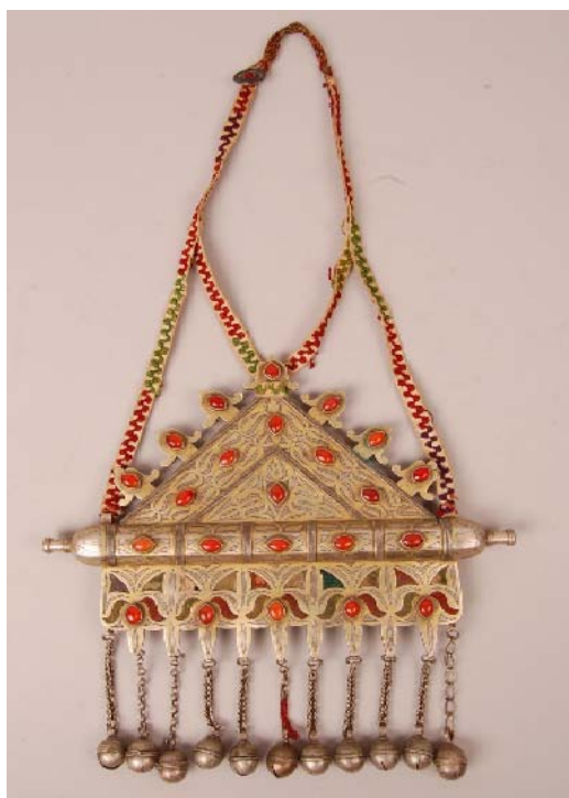
تصویر ۶. تومار نمونه ۵

در اغلب موارد، از آب‌طلا برای آبکاری موضعی روی سطوح بدنه فلزی استفاده شده است (تصویر ۶) و نقش‌های اسلیمی به این روش طلایی رنگ و از زمینه نقره‌ای متمایز شده‌اند. دلیل کاربست نقره را می‌توان به باور ترکمن‌ها مرتبط دانست.