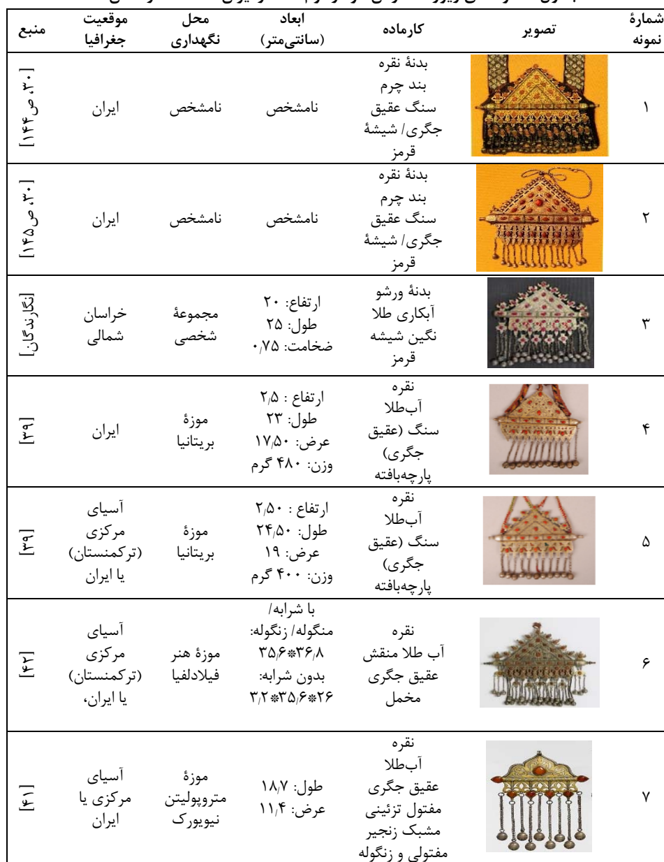
جدول ۱. نمونه‌های زیورآلات زنان: تومار قوم تکه در ایران