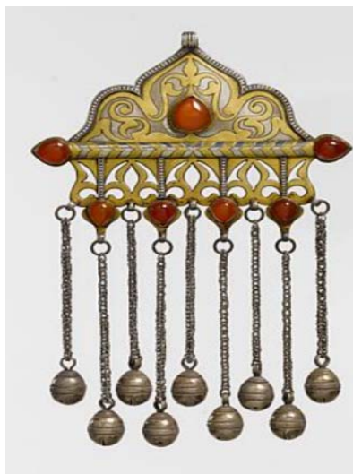
تصویر ۸. تومار نمونه ۷

همه سطوح فلزی تومار با نقوش انتزاعی اسلیمی مزین شده است. این نقش‌مایه پیشینه دیرینه‌ای در هنرهای ایران پیش از اسلام دارد [۲، ص ۵۱]. با وجود این، در دوران اسلامی تکمیل و به تنوع و تکرر به کار گرفته شد. برش‌کاری، خم‌کاری و جوش‌کاری ورق فلز هر امکانی را در طراحی هرگونه خط، نقطه و سطح از شکسته تا منحنی را میسر می‌کند. در این اثر، توسط تکنیک قلمزنی نقوش ساده اسلیمی و کم‌عمق ایجاد شده‌اند. با ایجاد مرزهای مشخص امکان آبرکاری موضعی فراهم شده است (تصویر ۸).