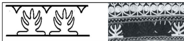
تصویر ۱۲. سوزن‌دوزی نقش باغ نقش بر لبه شلوار ترکمن [۱۴، ص ۷۶]

در شمنیزم، دین قبل از اسلام آوردن ترکمانان، جد شمن «اودون» از یک درخت زاده می‌شود [۴۰، ص ۷]. در آیین شمنی، غان را در نقش درخت حیات با هفت شاخه به صورت دیرک هفت‌شکافه می‌ساختند که مظهر هفت سیاره و مراحل صعود به آسمان بود [۲۷، ص ۱۲۷]. براساس باور رایج شمنیستی، زمین و بهشت با درختی که از مرکز زمین رشد کرده به هم مرتبطاند. این مسیر باید توسط روح شمن طی شود. در راه سفر به بهشت، روح شمن از سطوح گوناگونی عبور می‌کند که با شاخه‌های درخت نشانه داده می‌شود. در سوزن‌دوزی ترکمن، نقشی به نام محراب‌گل وجود دارد که ترکیبی از نقش درخت داخل محراب است. طبق اعتقادات شمنی درواقع درخت بهشت و زمین را به هم متصل می‌کند [۹، ص ۱۹-۲۳]. تصویر ۱۲ نقش درخت زندگی بر سوزن‌دوزی بر لبه شلوار زنان ترکمن است. این نقش یک تنه عمودی در میانه و دو ردیف خط منحنی متقارن دارد. استفاده از تیرک‌های چوبی به‌منزله نمادی از درخت حیات، که بهشت را به زمین متصل می‌کند، سنت رایجی در میان اقوام مختلف ترک در سراسر جهان است.