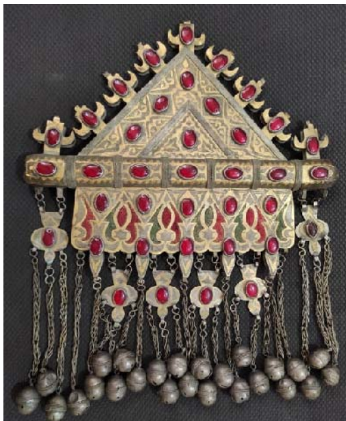
تصویر ۲. زیور تومار، ایل تکه، خراسان شمالی (نمونه ۳)

معمولاً تومارهای بزرگ حدود ۱۷ تا ۲۵ سانتی‌متر طول دارند و نسبتاً سنگین‌اند؛ بنابراین برای استفاده با بندی چرمی، پارچه‌ای یا نخ‌ی به نام الجه‌یوپ یا با بند مهره‌داری چون دانه‌های تسبیح به نام هونجی یا با تکه‌های هندسی کوچکی که به هم متصل شده باشند یا با کمک زنجیر بر گردن انداخته و در جلوی سینه آویزان می‌شوند. به‌ندرت ممکن است روی لباس در قسمت پهلوها دوخته شوند و گاه با کمک بند از روی شانه دختران جوان آویزان می‌شود [۳۱، ص ۲۳۳۹].