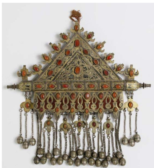
تصویر ۴. تومار نمونه ۶

در برخی نمونه‌ها (شماره ۳، ۴، ۵، ۶) فضاهای مشبک‌شده با پارچه مخمل به رنگ سبز و قرمز با ریتمی خاص اغلب یک در میان پوشانده شده است. همه نمونه‌ها شرابه دارند (تصویر