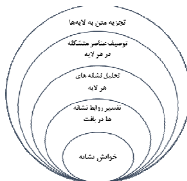
نمودار ۱. مدل پیازی فرایند تحلیل نشانه‌شناسی لایه‌ای زیورآلات تومار

تحلیل نشانه‌شناختی از نوع تحلیل متن هستند، زیرا یک نشانه هرگز نمی‌تواند در انزوا و منفک از رمزگانی که آن را ممکن کرده بررسی شود. رولان بارت مفهومی با نام لنگر را مطرح می‌کند. لایه لنگر حکم تثبیت‌کننده برای متن دارد و از پراکندگی و شناور شدن احتمالی نشانه‌های متن جلوگیری می‌کند [۲۱، ص ۲۰۹-۲۱۵]. در این مقاله، مطابق مدل پیازی ارائه‌شده در نمودار ۱، نشانه‌شناسی لایه‌ای زیور تومار بر مبنای تجزیه لایه‌ها، توصیف عناصر هر لایه، تحلیل نشانه‌های هر لایه، تفسیر روابط نشانه‌ها در بافت متن، کارکردهای متن، روابط بین‌لایه‌ای، بینارمزگانی و فرامتنی آن‌ها در بافت متنی پیدایش نشانه‌ها صورت می‌گیرد.