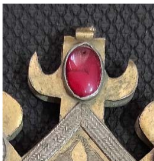
تصویر ۱۱. نقش درخت حیات بر دو ضلع بالایی مثلث تومار

در برخی نمونه‌ها، دو ضلع بالای مثلث نقش‌مایه‌ای انتزاعی از درخت زندگی تکرار می‌شود (تصویر ۱۱). در زبان ترکمنی به درخت زندگی «پاشایش باغت» گویند. درخت زندگی در «مرکز» عالم واقع است و آسمان و زمین و جهان زیرین (دوزخ) را به هم می‌پیوندد [۵، ص ۲۸۵].