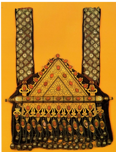
تصویر ۳. تومار نمونه ۱