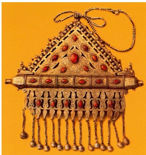
تصویر ۷. تومار نمونه ۲

در اولین نگاه به تومار، نگین‌های مرصع سرخ‌رنگ به صورت پراکنده در تمامی سطوح و روی نقش‌مایه‌های دورادور تومار جلب نظر می‌کند (تصویر ۷). این نگین‌ها از عقیق جگری یا بدل ارزان آن شیشه به رنگ قرمز هستند. عقیق ۱ از جمله سنگ‌های نیمه قیمتی است که از دیرباز میان ملل مختلف نقش درمان‌گری و جایگاه مقدسی در داشته است. در مناطق مختلف تنوع رنگ بسیار دارد. در زیورآلات ترکمن از عقیق جگری استفاده شده است.