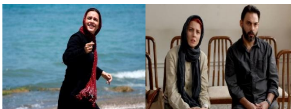
تصویر شماره ۴. فیلم «درباره‌الی» و «جدایی نادر از سیمین»

به معنای مهم و کلیدی بودن شخصیت، نوع بافت روانی که براساس سادگی و پیچیدگی نقش استخراج شده، نوع فعل و انفعال و تعداد شخصیت‌های زنان است. نقش زنان در فیلم‌های فرهادی، از جهت اصلی و خرد بودن متفاوت است، اما می‌توان همه آنها را به نوعی مکمل شخصیت مرد داستان دانست. از ۱۶ شخصیت مورد بررسی، تنها ۴ کاراکتر شخصیتی پویا دارند. اکثر تصویرسازی‌های فرهادی از زنان، نمایش شخصیت‌های ساده‌ای است که در برابر آنچه به وجود آمده و باید با آن مواجه شوند، منفعل هستند.