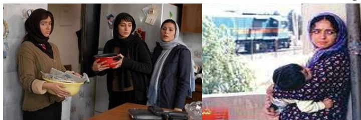
تصویر شماره ۱. فیلم چهارشنبه‌سوری و شهر زیبا

می‌توان دریافت که تقریباً همهٔ زنانی که نقش محوری فیلم‌ها را دارند، در تمام دوره‌ها به انجام فعالیت‌های منتسب به خانه‌داری پرداخته‌اند. پذیرایی از دیگران، آشپزی، مرتب و تمیز کردن منزل در میان زنان شایع است؛ این‌ها فعالیت‌هایی هستند که در فضای بسته و اغلب در خانه انجام می‌شوند و غیر از آن، فعالیت‌هایی مانند خرید وجود دارد که در فضای باز صورت می‌گیرد. در این بخش می‌توان شاهد تأکید فرهادی بر وجوه خانه‌داری زنان بود. اصرار وی برای دیده شدن زنان در این شرایط به نوعی تأکید بر اهمیت وظیفهٔ خانه‌داری برای زنان و تأیید بر تصورات قالبی در این حوزه است. ۱۱ شخصیت از ۱۶ زن مورد بررسی در این آثار، در حال نگهداری از فرزند یا دیگران مشاهده می‌شوند. می‌توان نتیجه گرفت در فضای فیلم‌های فرهادی، زنان موظف به نگهداری از کودکان و در صورت نیاز، ملزم به نگهداری از دیگران هستند.