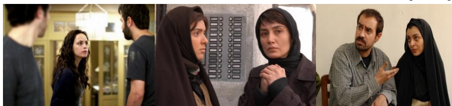
تصویر شماره ۳. فیلم «گذشته»، «چهارشنبه‌سوری» و «جدایی نادر از سیمین»

در این قسمت بررسی مقولات فردی زنان در آثار اصغر فرهادی در جدول شماره ۴ بیان شده است. مقوله نوع پوشش با مفاهیمی چون پوشش سنتی مذهبی، پوشش دوگانه (سنتی- مدرن)، پوشش ایدئولوژیک دینی، پوشش زیبایی‌شناختی و پوشش راحت بررسی شده‌اند. استفاده از پوشش‌های مختلف، نوع پوشش و سبک آن، با توجه به گزاره‌ها نگاشته شده‌اند. در بحث پوشش زنان به دلیل تفاوت دو فیلم «گذشته» و «همه می‌دانند» از جهت کشور محل ساخت فیلم، به نوعی اختلال در روند بررسی شخصیت‌ها به وجود آمد. پوشش شخصیت‌های این دو فیلم امکان مقایسه با سایر آثار را ندارد، اما در فیلم‌های ایرانی فرهادی، زنان قشر پایین جامعه در پوشش مذهبی سنتی دیده می‌شوند و پوشش زنان قشر متوسط و بالا، با توجه به مفاهیم زیبایی‌شناختی قابل تعریف است که پوششی غیر ایدئولوژیک محسوب می‌شود. مقوله نوع باورها در قالب مفاهیمی همچون باورهای سنتی، دینی و مدرن، از گزاره‌ها استخراج می‌شوند. در مبحث نوع باور شخصیت‌ها نیز همانند بحث پوشش، زنان قشر پایین با باورهای سنتی و مذهبی دیده می‌شوند و آنچه در زنان قشر متوسط و بالا می‌بینیم، مانند باور به راستگویی، آزادی و برابری را می‌توان با عنوان باورهای مدرن تعریف کنیم که ریشه مذهبی و ایدئولوژیک ندارند.