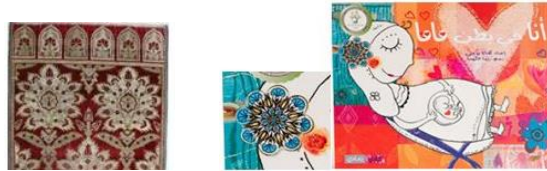
تصویر ۱۱. طرح جلد داستان آنا فی بطن ماما (URL 7)

امی، گل لاله و گل میخک دیده می‌شود (تصویر ۱۱). استفاده از ترکیب این دو گل در هنر اسلامی به‌ویژه منسوجات عثمانی دیده می‌شود (تصویر ۱۲). در عراق، در طرح داستان نبی/الله موسی، نقوشی در تزئین قاب تصاویر به‌کار رفته که یادآور تزئینات مقابر فراعنه است (تصویر ۱۳ و ۱۴).